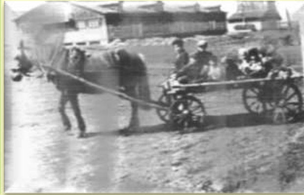
всё возили на быках