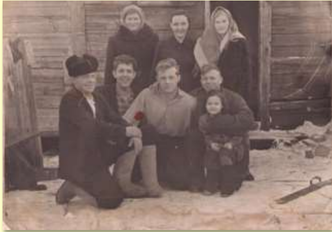
Семья дедушки. Снимок 50-ых годов.