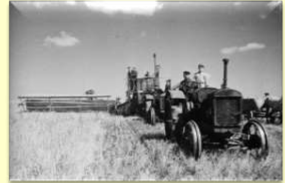
Трактор «СХТЗ 1530»