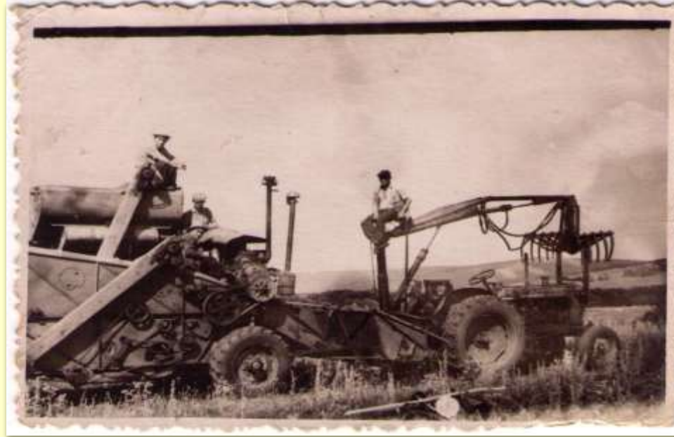
Уборка урожая на отделении «Вперед»,